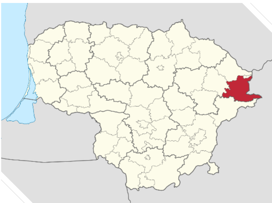
1 pav. Ignalinos rajono geografinė padėtis Lietuvos žemėlapyje

Ignalina yra Ignalinos rajono savivaldybės centras, esantis šiaurės rytų Lietuvoje. Pagal NUTS klasifikatorių, jis priklauso Vidurio ir vakarų Lietuvos regionui. Ignalinos rajonas priklauso Utenos apskričiai. Miesto plotas – 6,9 kv.km. Ignalinos miestą sudaro penkios seniūnaitijos: Gavaičio, Aukštaičių, Centro, Budrių, Vilniaus gatvės. Miestą supa aštuoni ežerai ir miškai, kas sudaro puikias sąlygas gyventojų poilsiui bei turizmo ir sveikatinimo paslaugų teikimui.