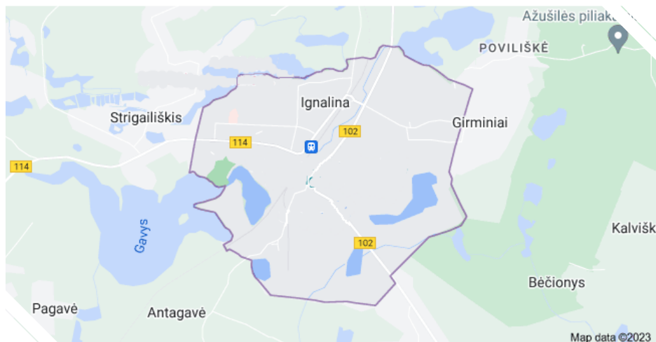
2 pav. Ignalinos miesto ribos

Ignalinos miesto plotas yra 6,9 kv.km, o tai sudaro 0,5 proc. Ignalinos rajono teritorijos (rajono plotas – 1367,6 kv.km).