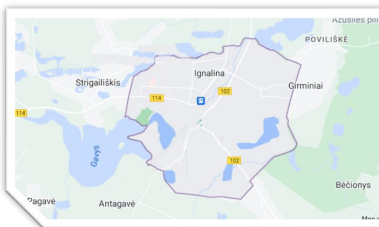
2 pav. Ignalinos miesto ribos ir geografinė padėtis

Ignalinos miesto plotas yra 6,9 kv.km, o tai sudaro 0,5 proc. Ignalinos rajono teritorijos (rajono plotas – 1367,6 kv.km).