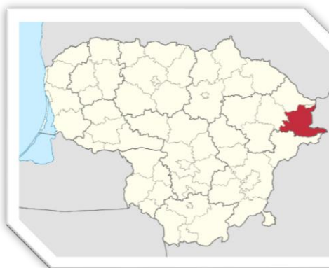
1 pav. Ignalinos rajono geografinė

Ignalina yra Ignalinos rajono savivaldybės centras, esantis šiaurės Rytų Lietuvoje. Pagal NUTS klasifikatorių, jis priklauso Vidurio ir vakarų Lietuvos regionui. Ignalinos rajonas priklauso Utenos apskričiai. Miesto plotas – 6,9 kv.km. Ignalinos mieste, Ignalinos miestą sudaro penkios seniūnaitijos: Gavaičio, Aukštaičių, Centro, Budrių, Vilniaus gatvės. Ignalinos mieste telkšo ežerai – Žaliasis (arba Šiekštys), Gavaitis, Agarinis, Diemenas, greta miesto – Gavio, Paplovinio, Palaukinio, Ilgio, Juodinio, Gulbinio, Mekšrinio ežerai. Ignalinos miestą supa ne tik ežerai, bet ir miškai, kurie sudaro puikias sąlygas gyventojų poilsiui bei turizmo ir sveikatinimo paslaugų teikimui.