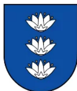
Ignalinos rajono savivaldybė